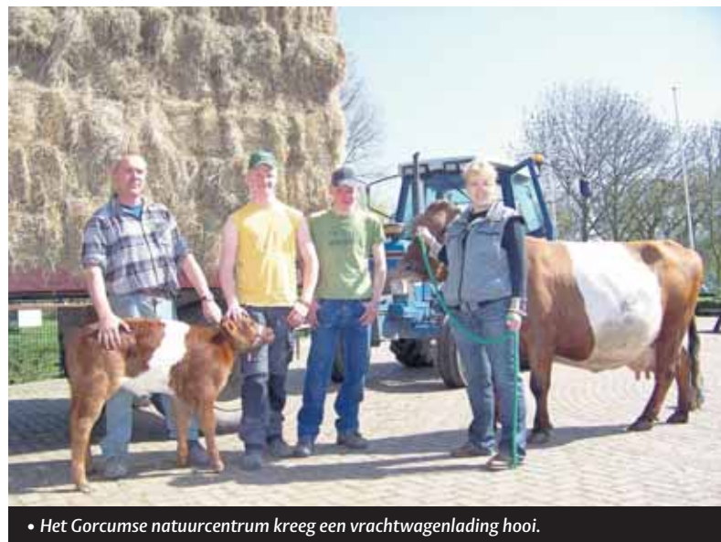
• Het Gorcumse natuurcentrum kreeg een vrachtwagenlading hooi.