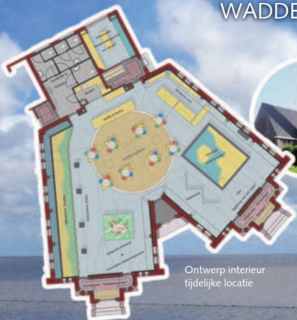
Ontwerp interieur tijdelijke locatie