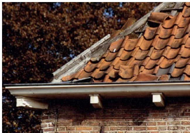
Voor het vervangen van slechte dakpannen door pannen van dezelfde soort en kleur is geen vergunning nodig.