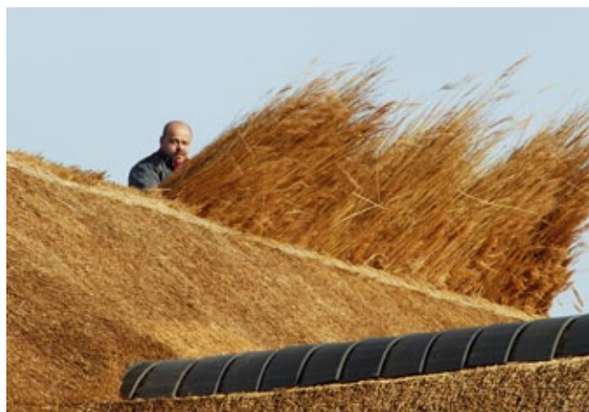
Voor het opstoppen van een rietdekking is geen vergunning nodig. Maar wanneer al het riet wordt vervangen is wel een vergunning nodig.